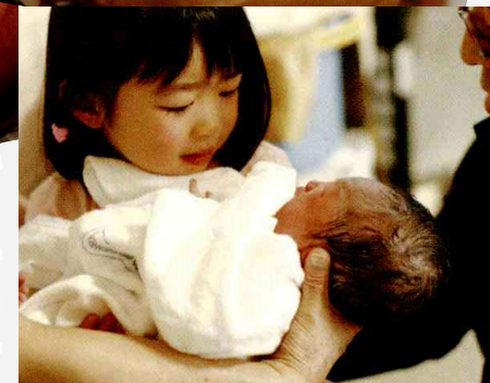
繁殖あづさ「うまれるものがたり」